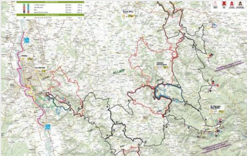
Carte espace VTT (Vichy Co)