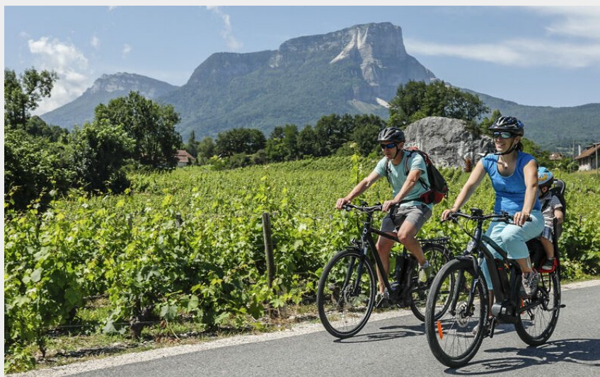
Véloroute (OT Cœur de Savoie)