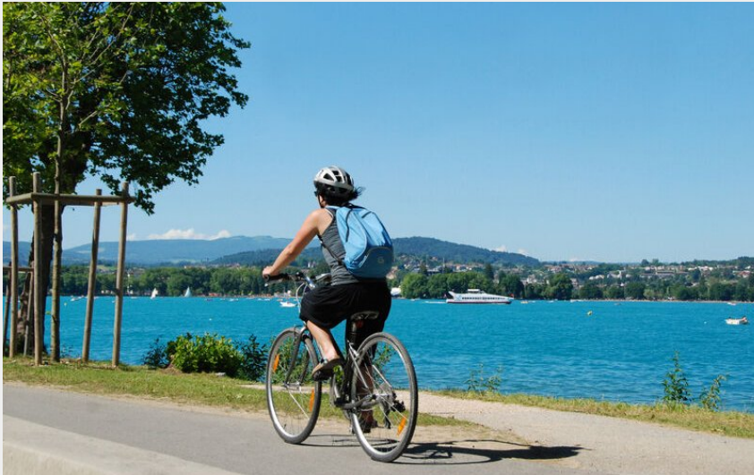
Balade à vélo sur les rives du lac d'Annecy