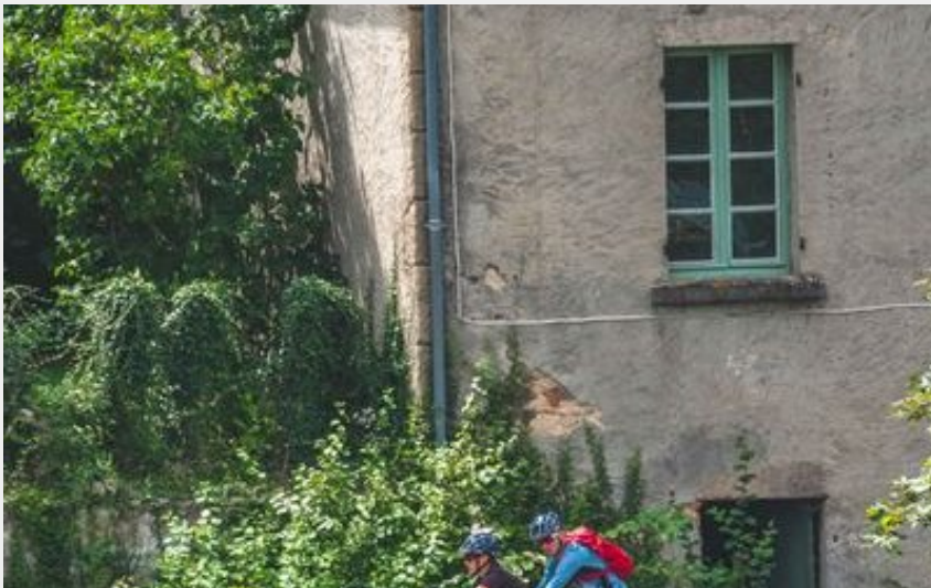
Circuit VTT n°92 à Châtel-Montagne