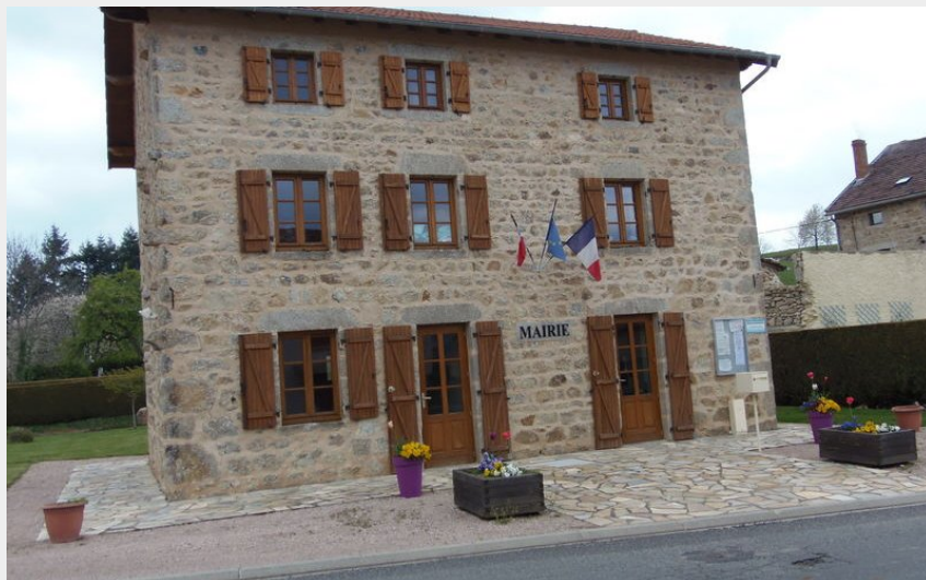
La mairie de la Guillermie