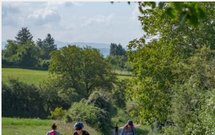
Circuit VTT n°86 à La Guillermie