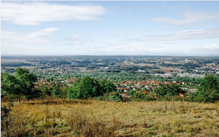
Le Vernet