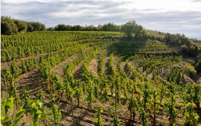
Vignoble (Cave de Tain)