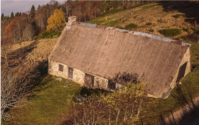
Les jasseries des Supeyres (Michel Sauvadet)