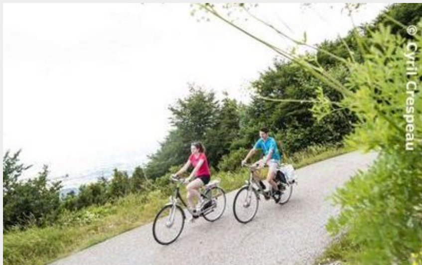
Les charbonniers du Vercors (Cyril Crespeau)