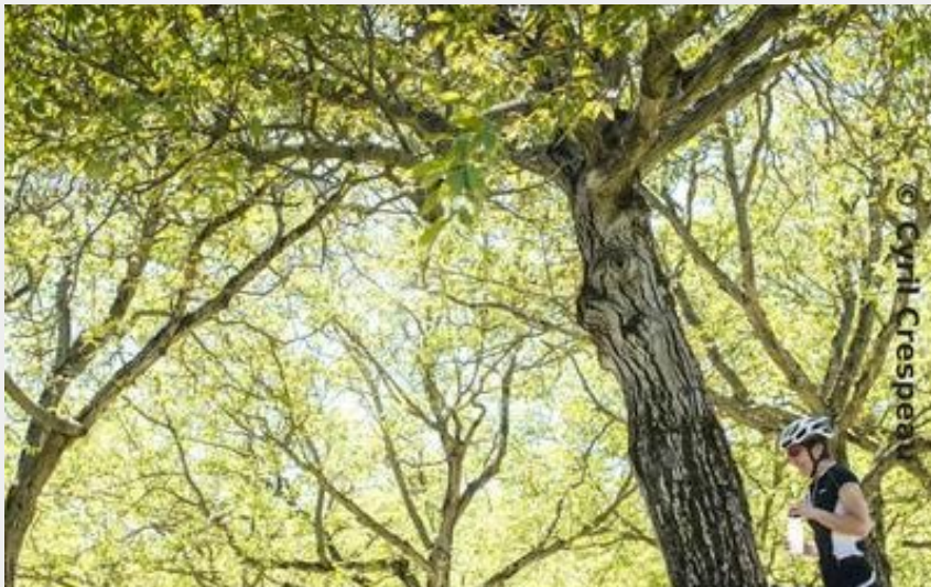
La Drômoise des familles (Cyril Crespeau)