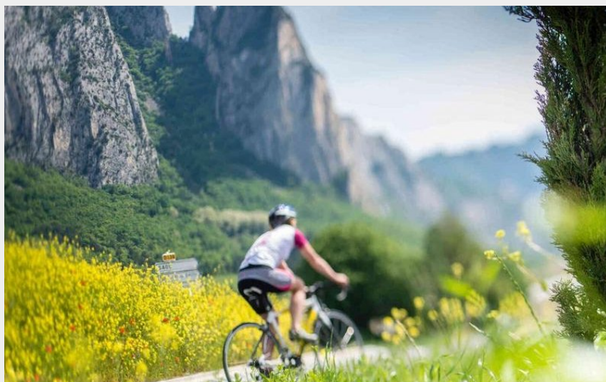
La forêt de Saou (Cyril Crespeau)