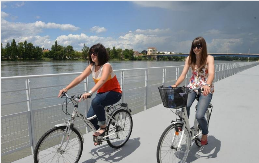
Les deux ponts (Francis Rey)