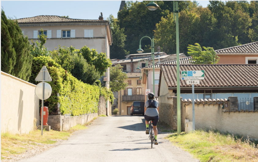
Le tour de la petite Raye (Dominique Guillot)