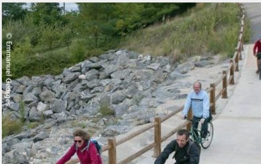
Au fil de l'eau (Emmanuel Georges)