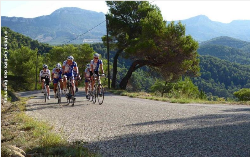
Le val de l'Aygue Marse (Union cycliste des Baronnies)