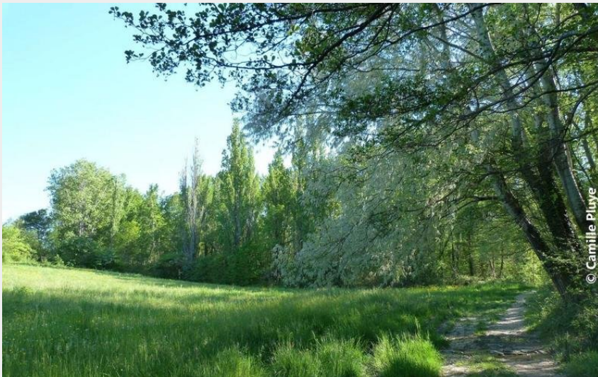
Balade en plaine (Camille Pluyc)