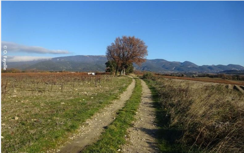
Le chemin des invasions (Olivier Fayolle)