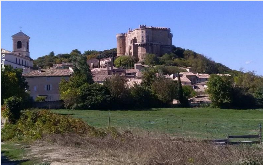
Les Esparants (Olivier Fayolle)