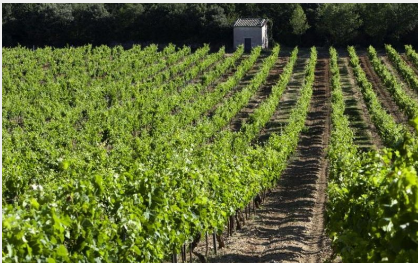
Des vignes et des cabanons (ODG Grignan les Adhemar)