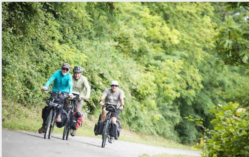
De l'Eygues au Bentrix (Cyril Crespeau)