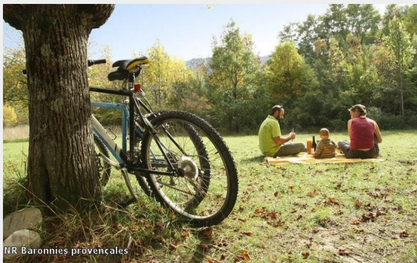
NR Baronnies provençales

Les deux rives de l'Oule (PNR Baronnies provençales)