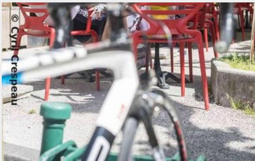
Tour de pays Drôme des Collines (Cyril Crespeau)