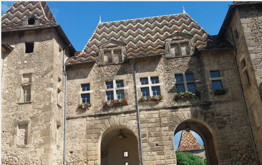
Saint Antoine l'Abbaye (SMottet)