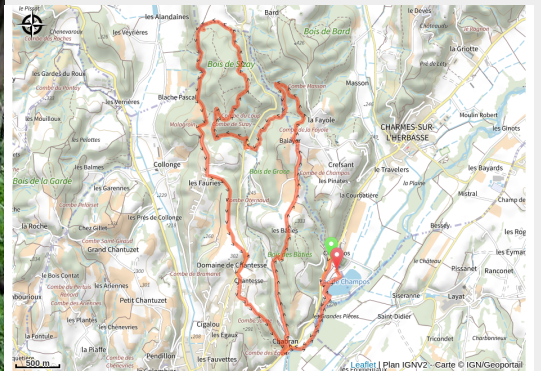
Bon plan VTT "La combe Oternaud et le bois de Sisay" (Bon plan VTT "La combe Oternaud et le bois de Sisay")