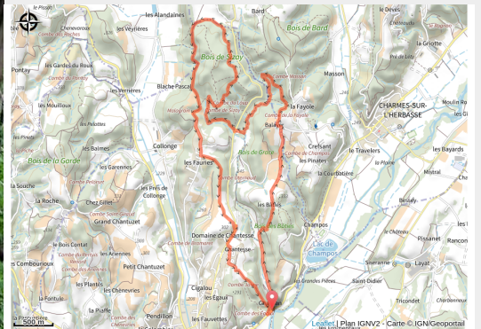
Bon plan VTT "La combe Oternaud et le bois de Sisay" (Bon plan VTT "La combe Oternaud et le bois de Sisay")