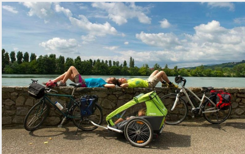
La vie du Rhône