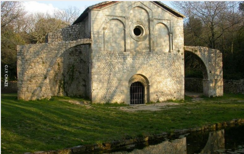
Le Val des Nymphes (J.Y. Chaze)