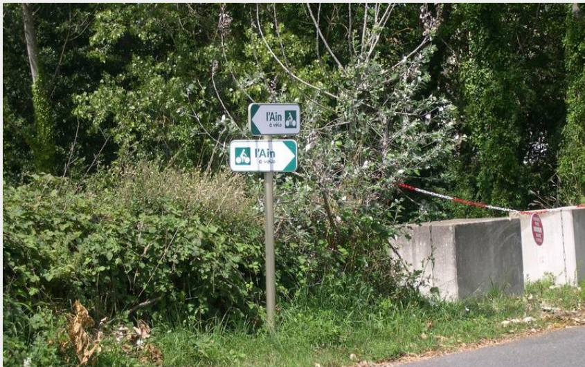
L'Ain à Vélo