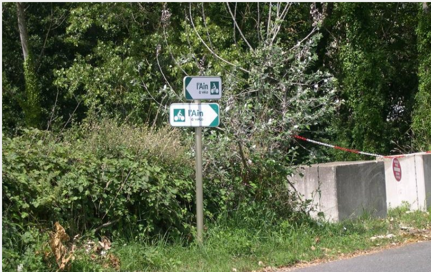
Jalonnement double sens