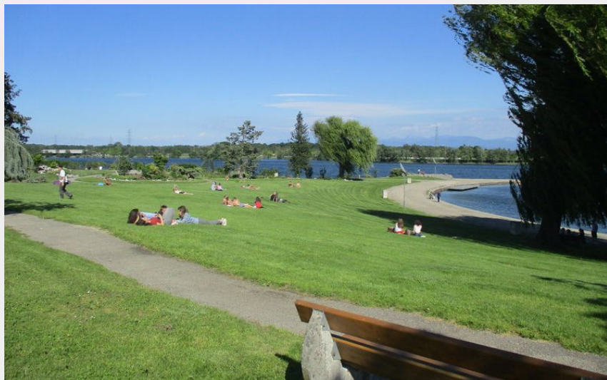
voie verte