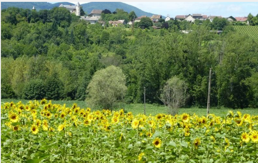
Château d'Andert