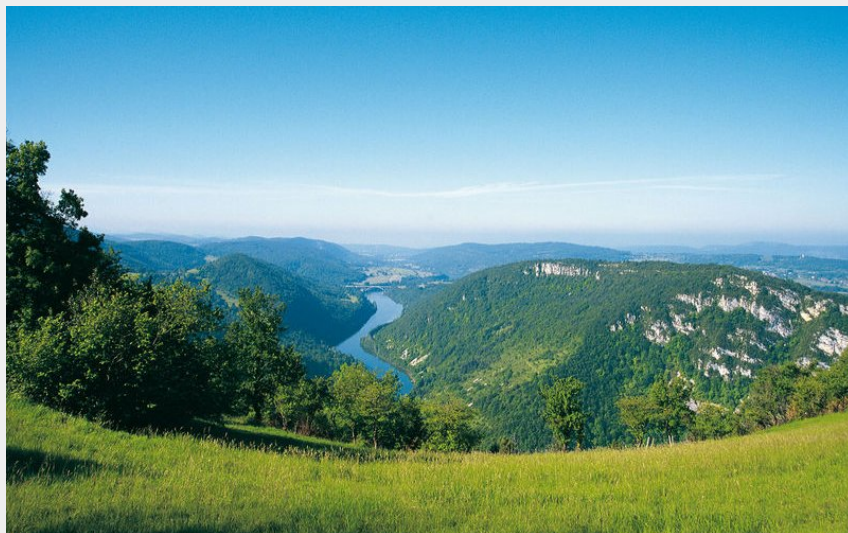
Vallée de l'Ain