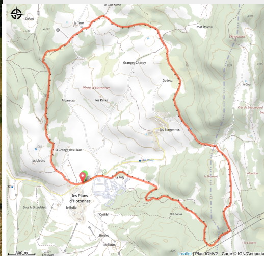
Circuit VTT 12 les Plans d'Hotonnes Plateau de Retord - Bugey Sud