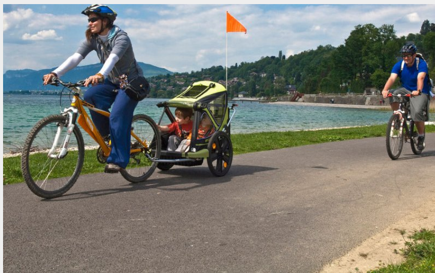
Vélo en famille sur les rives du lac du Bourget