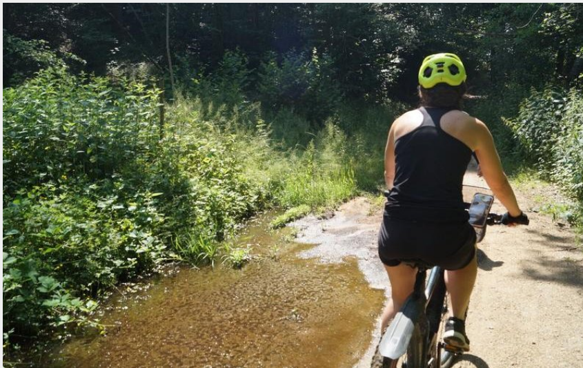
VTT (OT Forez Est)