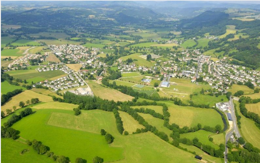
Vue aérienne (CABA)