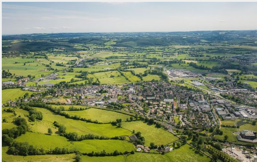
Vue aérienne (CABA)