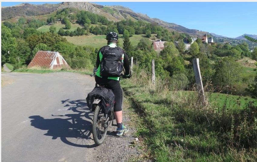
Sur la route des crêtes (CD15-ST)