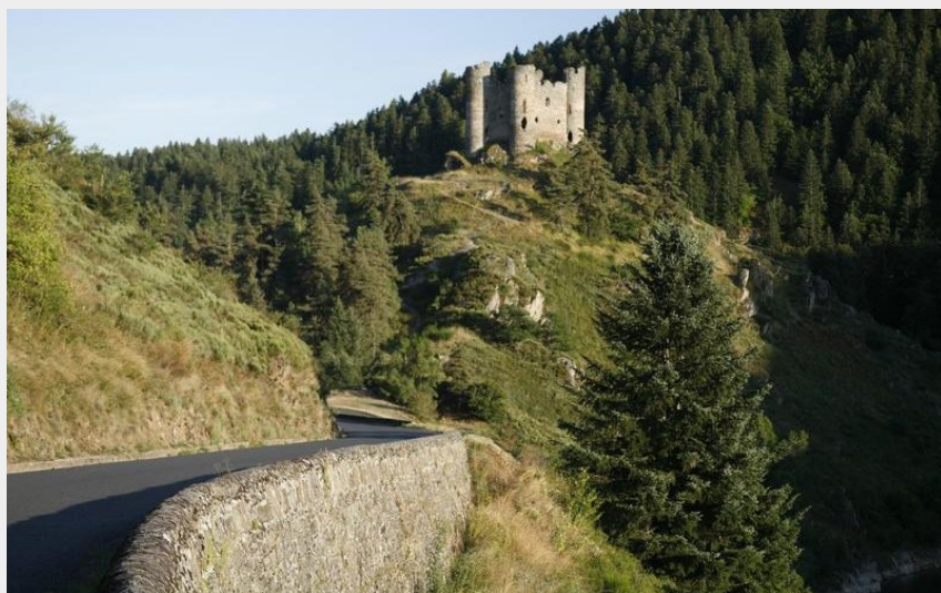
Le château d'Alleuze (H Vidal)