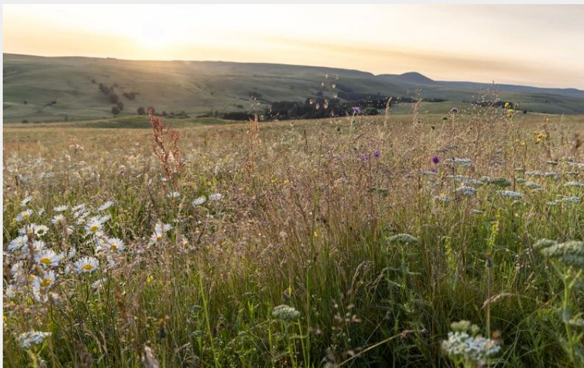
Vue sur le Cézaillier (B. Colomb)