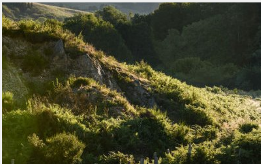
Du Sancy aux Combrailles