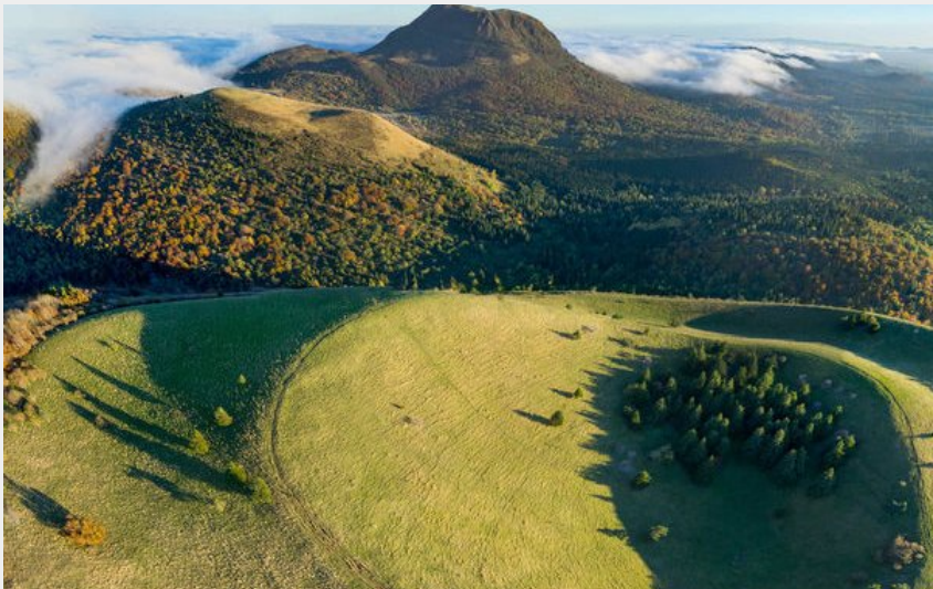
Chaîne des Puys