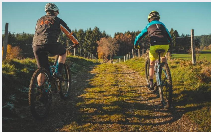
Balade en VTT à Saint-Romain-la-Motte