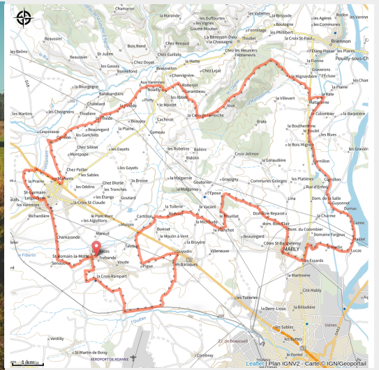
Balade en VTT à Saint-Romain-la-Motte

Un parcours gravel assez facile à travers la campagne jusqu'au canal de Roanne à Digoin. Faites une halte à la Gravière aux Oiseaux, Espace Naturel sensible roannais.