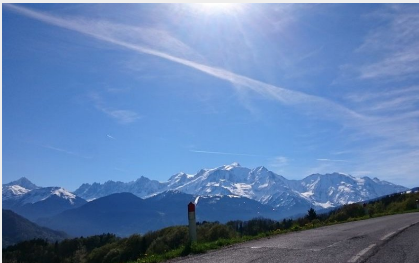
43 Circuit Mont Blanc