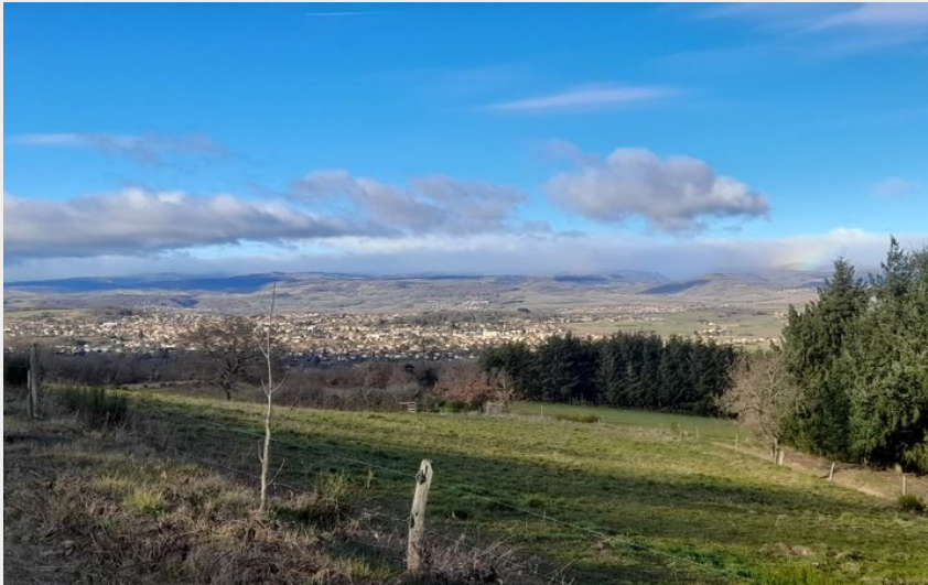
Les rochers Montfaucons (@ybastin)