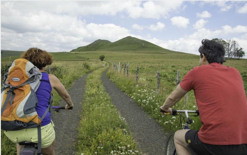
VTT Cézallier