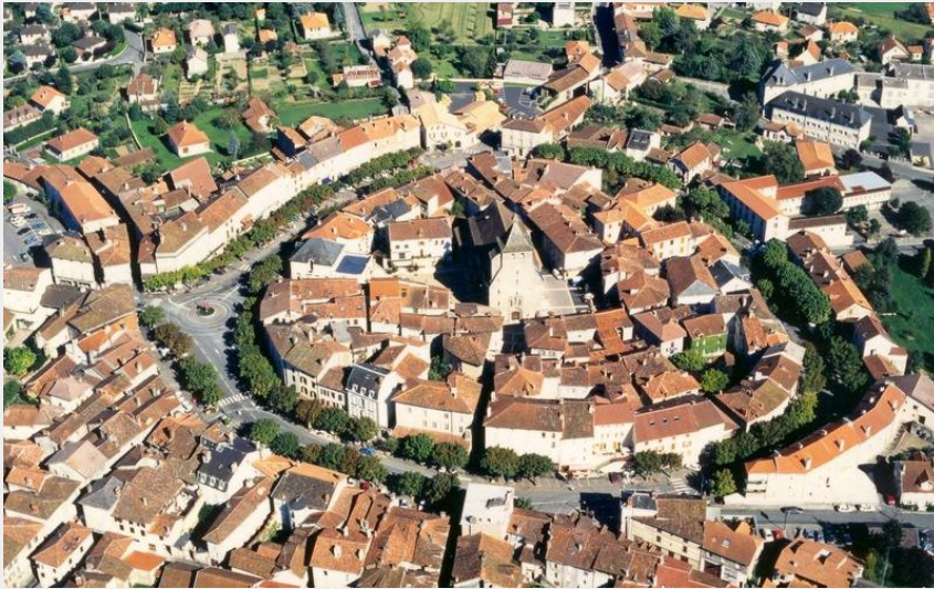
Mours (OT Châtaigneraie)