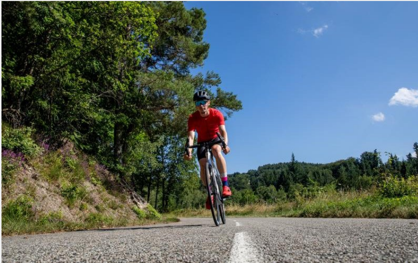
Entre Cère et Rance (Pierre Soissons)