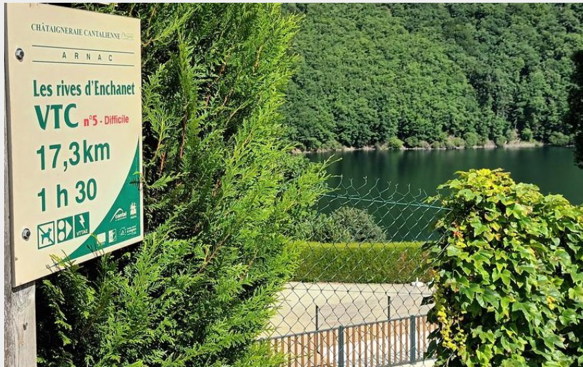
Lac d'Enchanet (OT Châtaigneraie)