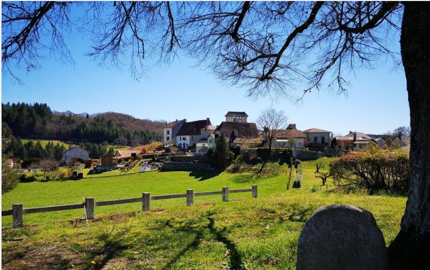
Pers (OT Châtaigneraie)